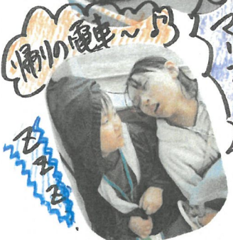
滑りの電車 マリオカートの