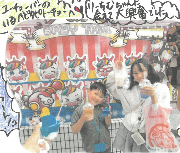
1-2000の 10-1000の BABY TAPI 1-2000の 10-1000の 1-2000の 10-1000の