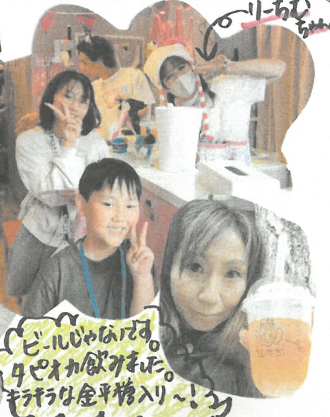
ビールはいいです。 4ペオカ飲みました。 キラキラな金平捲入り〜